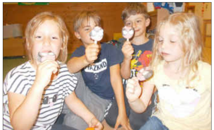
Das Abschiedsfest unserer „Großen“ fand aufgrund des unbeständigen Wetters nicht an unserem Waldplatz, sondern in der protestantischen Kirche statt. Eltern, Geschwister und Großeltern durften