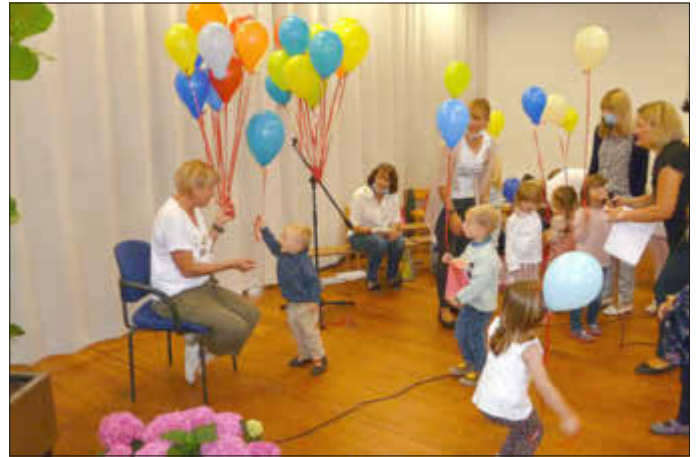
Mit einem Luftballon überbrachte jedes Kitakind einen guten Ruhestandwunsch

Die Unterlagen (Erläuterungsbericht und Anlagen) stehen ab sofort bis zum 10.09.2021 auf der Internetseite der VG Bellheim unter www.vg-bellheim.de --> Gemeinden --> Zeiskam --> Dorferneuerung zur Verfügung. Nach vorheriger Terminvereinbarung können die Unterlagen auch in der Bauabteilung der Verbandsgemeinde Bellheim, Schubertstraße 18, 76756 Bellheim eingesehen werden. Bitte wenden Sie sich hierzu an Herrn Guz (Tel. 07272/7008-401, E-Mail: m.guz@vg-bellheim.de ). Ebenso besteht die Möglichkeit zur Einsichtnahme im Rathaus, Hauptstraße 34, 67378 Zeiskam während der Sprechzeiten (Mittwoch 16:45 bis 18:00 Uhr) nach telefonischer Terminvereinbarung mit Ortsbürgermeisterin Susanne Lechner (06347/918375).