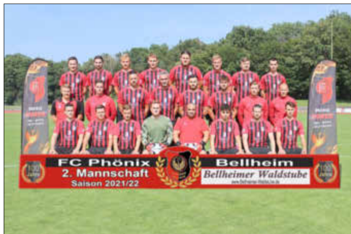
Bild der 2. Mannschaft in der laufenden Spielsaison: 2021-2022