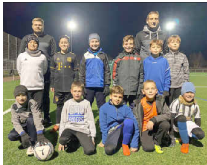
Das Bild zeigt die Jahrgänge 2011/2012. Hier sind die Plätze bereits ausgebucht.

Die JSG Hainbach bietet ein zusätzliches Fördertraining an.