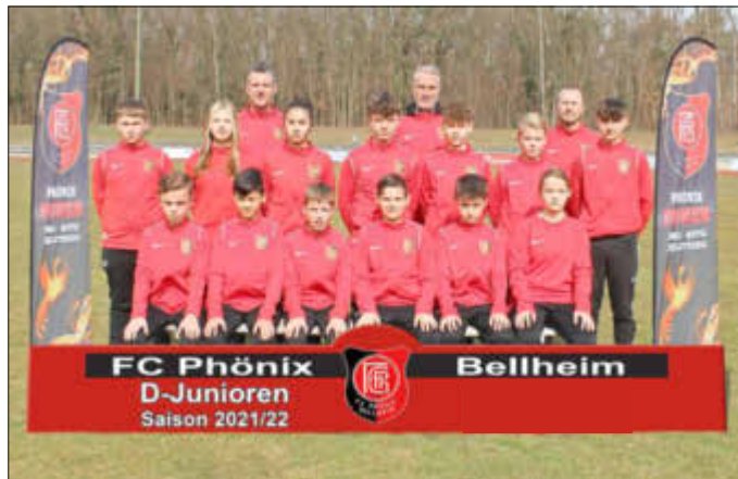
Die D-Jugend mit ihren neuen Trainingsanzügen der Firma Hoffmann

Zum wiederholten Male hat die Firma Hoffmann, Schrott & Metallhandel aus Germersheim die Spielerinnen und Spieler unserer D-Jugend mit Trainingsanzügen ausgestattet. Die Mannschaft und das Trainer-team bedanken sich recht herzlich bei der Firma Hoffmann!