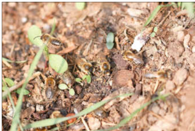
Es ist eine schier unmögliche Aufgabe Erdbienen zu fotografieren, da sie sehr „flink“ unterwegs sind !

Dreiviertel aller einheimischen Wildbienenarten nisten im Erdboden. In Deutschland leben mehr als 560 bekannte Wildbienenarten. Rund 70 % der Wildbienen bauen ihre Nester in den Boden: Das sind die sogenannten Erd- bzw. Sandbienen. Äußerlich unterscheiden sich Honig- und Erdbienen bei genauerem Hinsehen sowohl in der Farbgebung als auch in der Körpergröße. Diese reicht von ganz kleinen 4 bis 5 Millimetern bis zu „unglaublichen“ 15 bis 16 Millimetern. Ein weiterer wichtiger Unterschied: Erdbienen sind völlig harmlos! Die Weibchen besitzen zwar einen Stachel, den sie in allergrößter Not auch einsetzen würden, allerdings können sie die menschliche Haut damit nicht durchdringen und stellen so keine Gefahr für den Menschen dar. Gerade jetzt im Frühjahr kann man vor allem die sog. Sandbienenarten beobachten. So auch in Zeiskam in dem Beet am Pfarrgarten. Das Beet wird seit Jahren vom NABU gepflegt und ist Heimat einer stattlichen Kolonie von Erdbienen. Hier handelt es sich nicht etwa um einen Staat mit einer Königin und vielen Helfern. Die Erdbienen leben als Einzelgänger und werden deshalb „solitär lebende Bienen“ genannt. Das hält sie aber nicht davon ab, dort wo es „passt“ eine Kolonie zu bilden. Bis zu schätzungsweise 1000 (!) der nützlichen und bedrohten Insekten leben dann auch in dem Zeiskamer Beet. In den letzten Tagen konnte dann auch bereits eine stattliche Anzahl bei den ersten Flugübungen beobachtet werden.