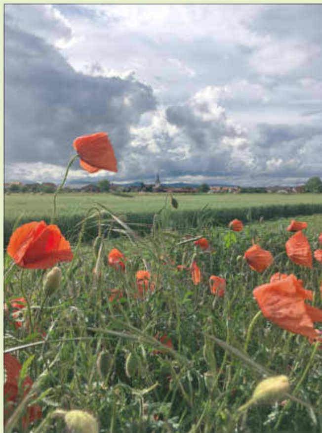
„Dorfblick durch Mohnblumen“