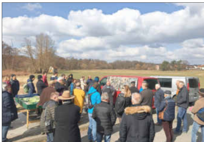
Beginn der Exkursion in Schwabach

Bei einer Exkursion in verschiedene Bereiche der fränkischen Wässerwiesen konnten die Gemeinsamkeiten und Unterschiede zwischen der südpfälzischen und der oberfränkischen Bewässerungspraxis festgestellt werden. Besonders beeindruckend sind die Wasserschöpfräder bei Möhrendorf, die als die einzigen Norias nördlich der Alpen bis heute unterhalten werden. Bei den Schaubewässerungen wurde deutlich, dass man viel voneinander lernen kann.