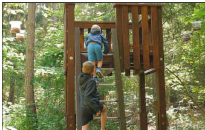
Der neue Kinder-Hochsitz wird von den Kindern ganz gespannt erkundet.

Die Praxis am Eck in Ottersheim spendet alljährlich für eine gute Sache und dieses Mal wählten sie den Walderlebnispfad aus. Jede Woche werden viele Kinder das ganze Jahr über von dieser Spende von stolzen 3000 Euro profitieren, denn der Pfad erfreut sich seit Corona-Beginn ständig steigender Besucherzahlen.