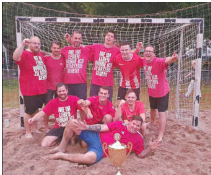
Der alte und neue Dorfmeister - Bei-de-Mama-Wohner