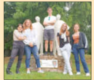
Die jugendlichen Teilnehmer/-innen im Stadtpark vor dem Denkmal der Partnerschaft

Die Gruppe der Jugendlichen war schon früh mit dem Zug nach Versailles gefahren, um Schloss und Park des Sonnenkönigs Ludwig XIV. kennenzulernen. Wegen der riesigen Ausmaße reichte aber ein ganzer Tag nicht, um alles zu sehen. Glücklicherweise war an diesem Tag der Park mit Musik und Wasserspielen wie gemacht für die Gäste aus der Pfalz. Beeindruckend war auch, dass der Zugang zum Schloss, wie auch am nächsten Tag zum Louvre in Paris, für die jugendlichen Besucher (bis 26 Jahre!) frei war. Hier könnten sich die deutschen Museen ein Beispiel nehmen. Am Abend dinierten wir gemeinsam in einem Restaurant in der Umgebung. Samstags begann der Vormittag wieder gemütlich. Jeder konnte seine Aktivitäten individuell planen. Mittags traf man sich im Salle des Granges zum gemeinsamen Mittagessen. Bei angeregten Unterhaltungen verging die Zeit sehr schnell. Danach fuhren wir gemeinsam zum Etang de La Tour. Dort erwartete uns ein Ranger des Nationalparks. Er erklärte uns anhand einer Karte den Zusammenhang des Seengebietes. Der Etang de La Tour ist das letzte Glied einer Kette von Teichen. Im 17. Jahrhundert war der Teich Teil