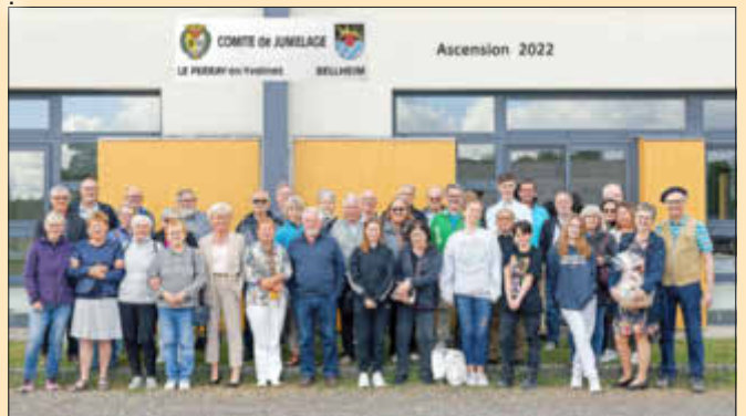
Die Teilnehmer der Fahrt mit ihren Gastgebern vor der Heimreise

Am Sonntagmorgen traf man sich nach dem Frühstück wieder im Mare au Loup. Nach dem obligatorischen Gruppenfoto verabschiedete man sich voneinander mit herzlichen Umarmungen und „bises“