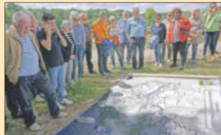
Vortrag am Etang de La Tour

eines hydraulischen Systems, das die Brunnen im Park des Schlosses von Versailles mit Wasser versorgte.