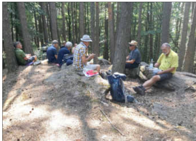
Picknick am Hornstein