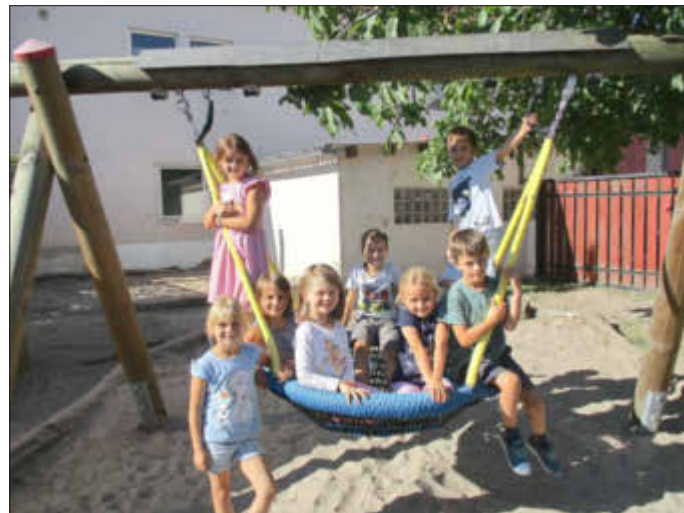
„Schön war es“

Die Übernachtung war sehr schön, aufregend und hat allen ganz viel Spaß gemacht!!!