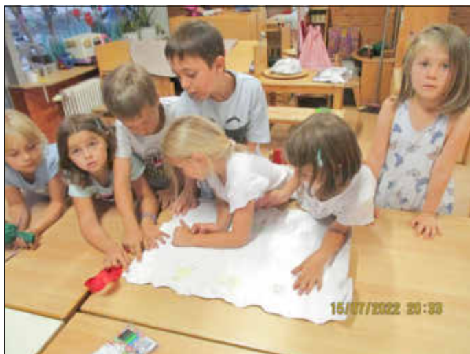
„Beim Studieren der Schatzkarte“

Nachdem die Eltern gegangen waren, begannen wir unseren Abend mit einer Schatzsuche im ganzen Kindergarten. Darauf folgte noch eine kleine Nachtwanderung. Als wir zurück im Kindergarten waren, wurden noch Sternenspritzer angemacht, ein Eis gegessen und ein bisschen getanzt. Dann haben wir uns Bettfertig gemacht und kurz nach Mitternacht, lagen alle im Bett und haben geschlafen.