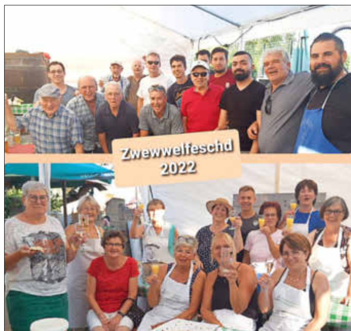
Helferinnen und Helfer des Zwewwlfeschts

Am Sonntag drängten sich wieder sehr viele Besucher auf dem deutsch-französischen Bauernmarkt. Auf dem Festplatz genossen die Besucher Zwewwlstreaks, Dampfnudeln, Bratwürste, Flammkuchen, Handkees mit Weiße Kees und auch die sehr beliebten „Fläschknepp“ mit Meerrettich. Trotz des sehr hohen Besucheransturms klappte die Organisation nahezu reibungslos, und so konnten die vielen Helferinnen und Helfer am Ende des Tages auf ein rundum gelungenes Zwewwlfescht zurückblicken.