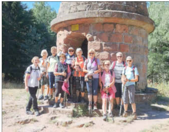
vor dem Ludwigsturm

mit der Rietburgbahn den bequemen Weg hoch zur Rietburg wählten. Oben angelangt ging es dann zu Fuß weiter. Bei angenehmen Temperaturen führte uns der Weg zunächst zum Ludwigsturm. Einige nutzten die Gelegenheit die Aussicht von dort oben zu genießen. Weiter ging es dann einem schönen Pfad folgend zum Kohlplatz und dann etwas steiler und anstrengender hoch bis zum Kesselberg. Nach einer kurzen Trinkpause wurde der Weg dann wieder angenehm flach und bald waren wir am Benderplatz, unterhalb des Schänzels angelangt. Der nun folgende schmale Wanderpfad führte und dann doch etwas steiler bergab, vorbei am Naturfreundehaus bis zum Hüttenbrunnen, unserer heutigen Einkehrstation. Nach dem Essen im schattigen Wald und dem ein oder anderen Stück Kuchen, wählten wir den Weg am Bach entlang bis zum Hilschweiher und weiter bis zur Talstation der Rietburgbahn und damit zum Ziel. Eine gelungene Wanderung und ein schöner Tag. Wir 11 Frauen und unser Wanderführer Arno haben immerhin 14km und 300hm zurückgelegt.