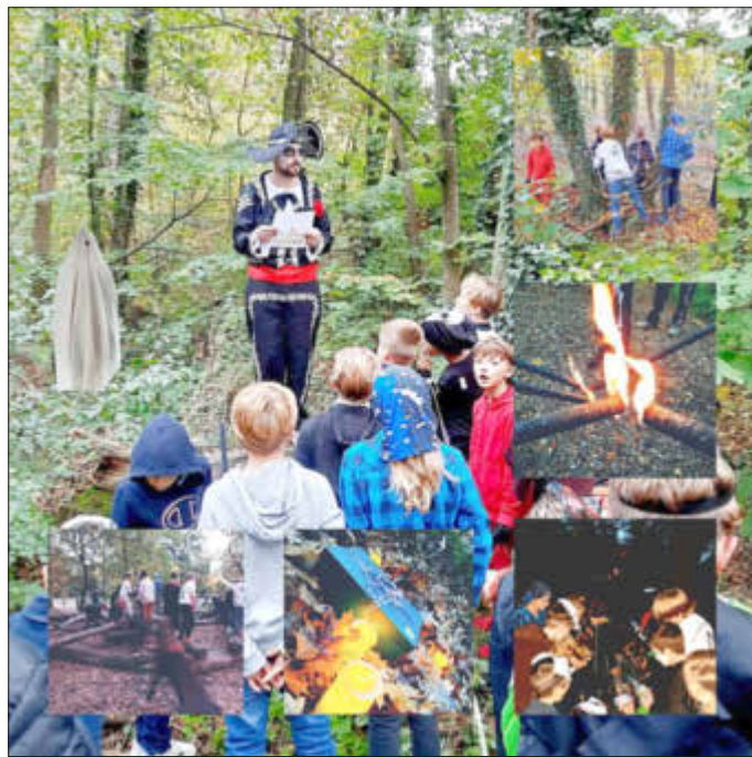
Die E-Jugend im Wald bei ihrer Halloween-Schnitzeljagd