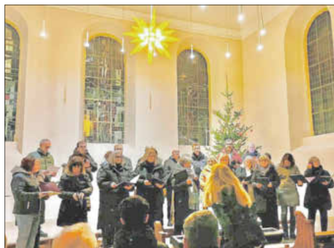
Die Happy Voices bei der Christmette in Gernersheim