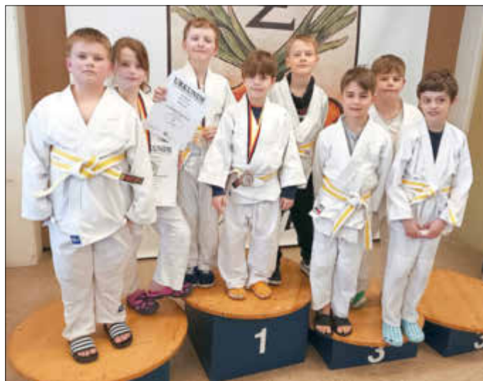
Ein Teil der Zeiskamer Teilnehmer beim Zeiskamer Osterturnier