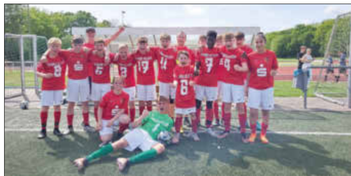
Das erfolgreiche C-Juniorenteam – 2022/23