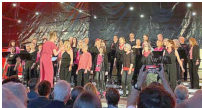
Die Happy Voices auf der Bühne...

Eine abgedunkelte Halle und eine große Bühne mit professioneller Licht- und Tontechnik – das erwartete die Besucher des Chorkonzerts unseres modernen Chors „Happy Voices“ am Abend des 6. Mai in der voll besetzten Zeiskamer Fuchsbachhalle.