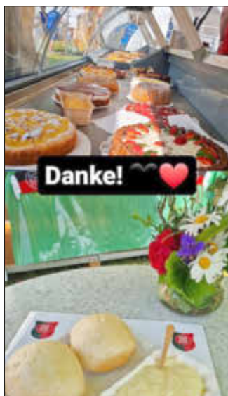
Kuchentheke und Dampfnudelverkauf

Wir trainieren jeden Mittwoch um 19:00 Uhr im Stadion. Interessierte Kicker ab 32 Jahre sind herzlich willkommen.