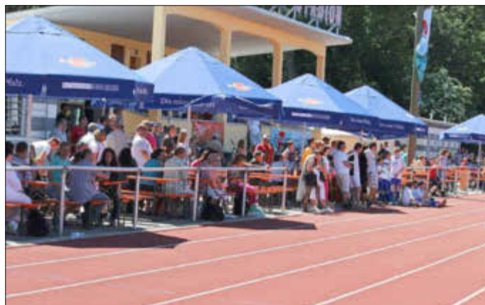
Zuschauerkulisse – Bellaris-Cup 2022

Die Kuchenspenden können am SA, dem 17.06.2023 ab 09:00 Uhr, sowie am SO, dem 18.06.2023 ab 08:00 Uhr im Franz – Hage – Stadion an der Kuchentheke bzw. im Kiosk abgegeben werden.