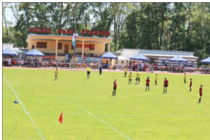
Anstoß zu einem Spiel bei der E-Jugend – Bellaris-Cup 2022

Für das leibliche Wohl, in Form von Speisen und Getränke, ist Bestens gesorgt.