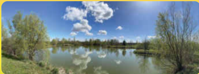
Angelverein Petri-Heil Zeiskam e.V.

(Google Maps Plus Code 67F2+HQ Zeiskam )