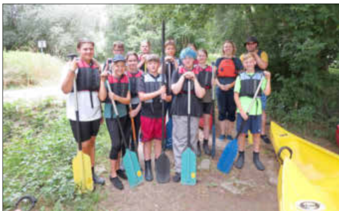
Rückblick Konfi-Aktion-Paddeltour – Samstag 01.07.23

Das nächste Treffen der Konfirmand*innen 2024 findet am Freitag, den 14.07.23 statt, von 16:00 – 18:00 Uhr im Gemeindehaus.