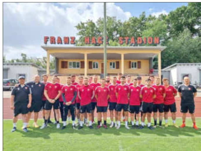
Trainingsauftakt der 1. Mannschaft - So., 02.07.2023 Spiel-saison: 2023-2024

Am Sonntagmorgen, 02.07.2023 um 11:00 Uhr, starteten die Phönixbuben in ihr erstes Training nach der etwas kurzen Sommerpause. Bei herrlichem Sonnenschein trainierte die Mannschaft knapp 1 ½ Stunden auf dem Rasenplatz, anschließend folgte das leckere Grillen mit den Fans und Spielern.