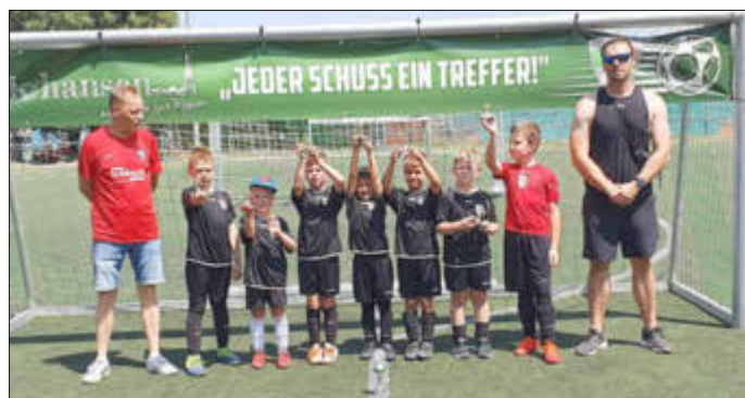
Die G-Jugend zum Saisonabschluss 2022-23 beim Turnier in Rheinzabern

Am SO, dem 09.07.2023 trafen sich unsere angehenden Leistungsträger der G Jugend des FC Phönix Bellheim in Rheinzabern zu Ihren letzten Turnier vor der Sommerpause. Bei schweißtreibenden Temperaturen von bis zu 37 Grad traten unsere talentierten Jungs bei fünf Spielen an, von denen Sie vier teilweise eindeutig gewannen. Nur im letzten Spiel mussten sich unsere Jungs geschlagen geben. Alles in allem ein gelungener Abschluss der mit einem Mannschafts- und Spielerpokale gekrönt wurde.