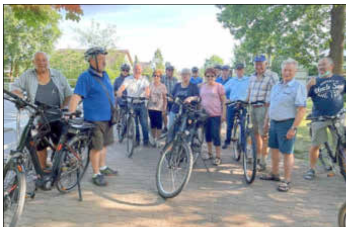
Archivbild zeigt die Radler vor der Abfahrt

Die nächste Radtour findet am Dienstag, 1. August 2023 statt; die Abfahrt erfolgt um 18 Uhr beim Abenteuerspielplatz. Der Abschluss findet in der Gaststätte „Bierstubb“, in der Fellach, statt. Bei Regen treffen wir uns direkt in der Gaststätte.