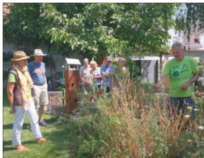
Die NaturbotschafterInnen sind begeistert vom Garten der Familie

Dank der Förderung im Bundesprogramm Biologische Vielfalt und durch das Umweltministerium Rheinland-Pfalz kann die zu Beginn des Jahres 2024 neu startende Ausbildung kostenlos angeboten werden. Zum Abschluss hat der Nabu Bellheim die Teilnehmer zu einer kleinen Exkursion auf den Gollenberg in Bellheim eingeladen, wo der NABU Bellheim einige Flächen unter Berücksichtigung des Naturschutzes pflegt.