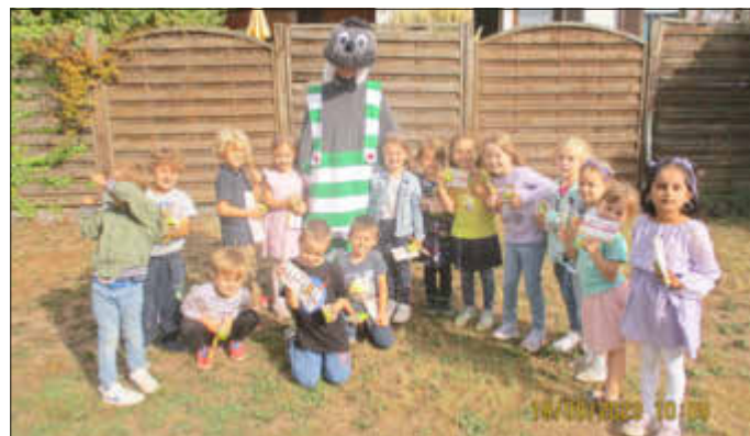
Die Vorschulkinder aus der Prot. Kindertagesstätte „Eden“