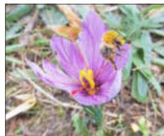
Der Safrankrokus bietet Pollen-nahrung für die letzten Hummeln des Jahres.

Es ist Herbst geworden, der Vogelzug steuert dem Höhepunkt entgegen. Schwalben, Pirole und Kuckucke haben uns längst verlassen. Ein Teil der Weißstörche unserer Heimat hat Afrika erreicht, die Mehrzahl überwintert wohl in Spanien. Durch unsere Verbandsgemeinde ziehen etliche Vogelarten und sind oft in unseren Gärten anzutreffen. So ziehen Rotkehlchen, Zilpzalp oder Grasmücken einzeln und unauffällig, während Stare beispielsweise in recht großen Schwärmen anzutreffen sind. In den Feldern rund um die Dörfer wurden in den letzten Tagen einige Trupps vom Kiebitz, dem Vogel des Jahres 2024 angetroffen. Im gut sortierten Kräutergarten blüht der Safrankrokus, auf den Wiesen die giftige Herbstzeitlose und ab und zu kann man Wanderfalter, wie den schwarz-weiß-roten Admiral antreffen.