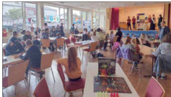
Ziehung der Preise