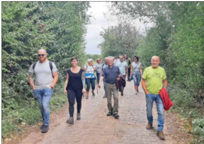
Herbstwanderung - auf dem Weg zur Klauentalhütte

Am 3. Oktober fand die traditionelle Herbstwanderung der Frohsinn-Chöre statt. Am frühen Nachmittag trafen sich viele wanderlustige Sängerinnen und Sänger an unserem Sängerheim „Zur Zwewwl“ und fuhren gemeinsam in die Weinberge bei Maikammer. Auf gut ausgebauten Wegen spazierten wir bei angenehmem Wetter gemütlich durch die Weinberge und genossen die Aussicht auf die Rheinebene. Beim Winzerhof Ernst in Maikammer legten wir eine gemütliche Rast ein, bevor wir uns auf den Weg zur Klauentalhütte machten. Leider erwischte uns dabei ein kurzer Regenschauer, jedoch waren wir für diesen Fall gut vorbereitet. In der Klauentalhütte angekommen, stärkten wir uns mit Pfälzer Spezialitäten und ließen den Wandertag in gesellig-fröhlicher Runde ausklingen.