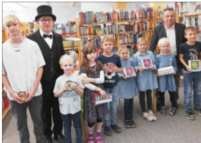
„Großes Lesesommer-Finale mit den stolzen Gewinnern und den neu gekrönten Lese-Hohheiten“