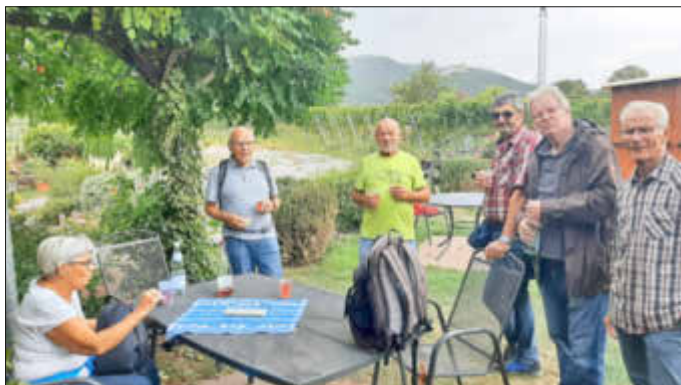
Herbstwanderung - Rast bei Maikammer