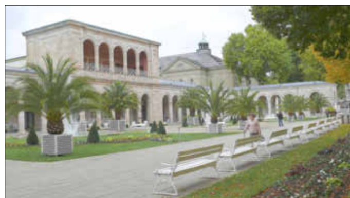
Bad Kissingen – Arkaden