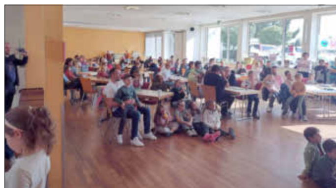
Warten auf die Verlosung

Das diesjährige Abschlussfest des Lesesommers fand am 15.10.2023 im Rahmen eines Spielenachmittags in Kooperation mit dem Förderverein für Kinder und Jugend Knittelsheim statt. Zu Beginn konnten wir wieder viele tolle Preise verlosen - dafür bedanken wir uns herzlich bei den Jugendherbergen in Rheinland-Pfalz und im Saarland, der VR Bank Südpfalz, dem Zoo Landau und dem Kletterpark Kandel.