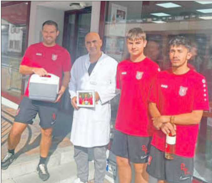
Die B-Jugend bedankt sich bei der Neuen Löwen Apotheke für die Kühlbox.