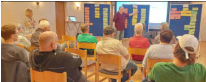
Abschlusspräsentation bei der Bürgerbeteiligung in Ottersheim am 11.10.23

Bei den „Bürgerbeteiligungen zum Klimaschutz“ wurden in den letzten Wochen in Knittelsheim, Bellheim, Zeiskam und Ottersheim viele Maßnahmen diskutiert, wie zukünftig Energie gespart und auf erneuerbare Energien umgestellt werden kann.