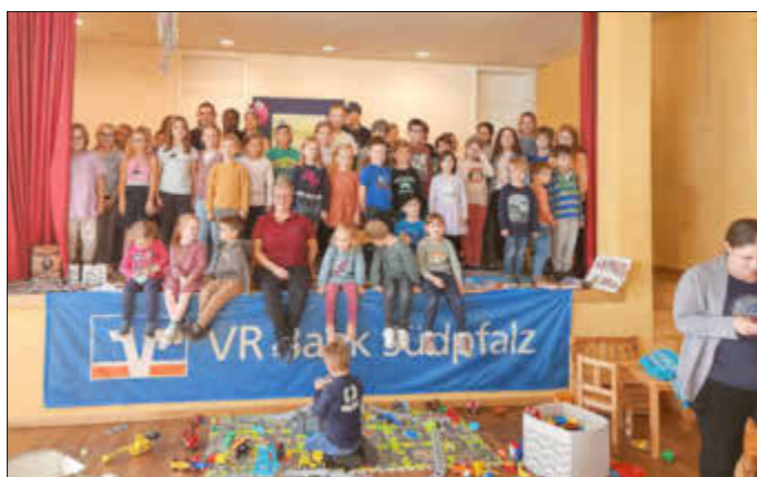
Gruppenbild der vielen Teilnehmer

Im letzten Jahr haben 27 Kinder erfolgreich an unserem Lesesommer teilgenommen – in diesem Jahr durften wir uns über 49 erfolgreiche Kinder und 495 gelesene Bücher freuen! Wir sind unglaublich stolz auf dieses tolle Ergebnis!