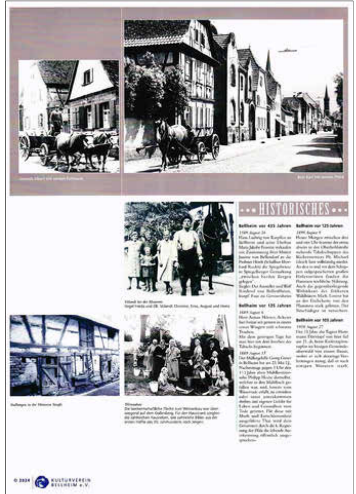
Die Rückseite des Monats August 2024

Der Kalender zeigt „Bellheimer Ansichten und Geschichten“ auf Vorder- und Rückseite von 12 Monatsblätter.