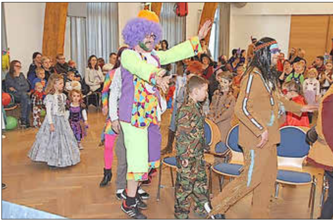
Eintritt frei! Die KGB freut sich auf euch!

Wann: 21.01.2024 Wo: Festhalle Bellheim Beginn: 14.11 Uhr