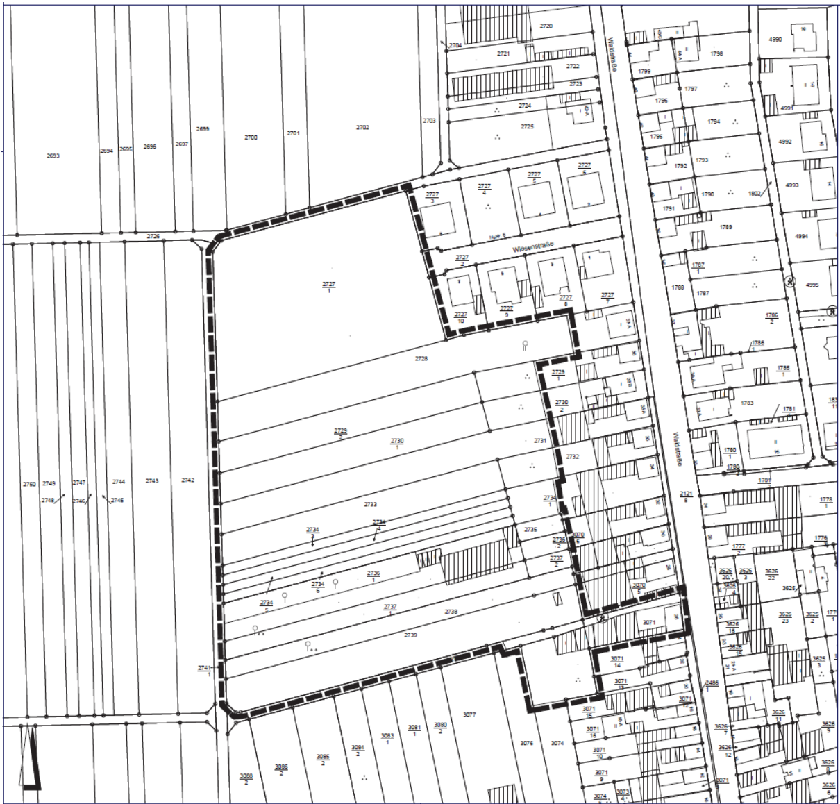
Geltungsbereich des Bebauungsplans (nicht maßstäblich)